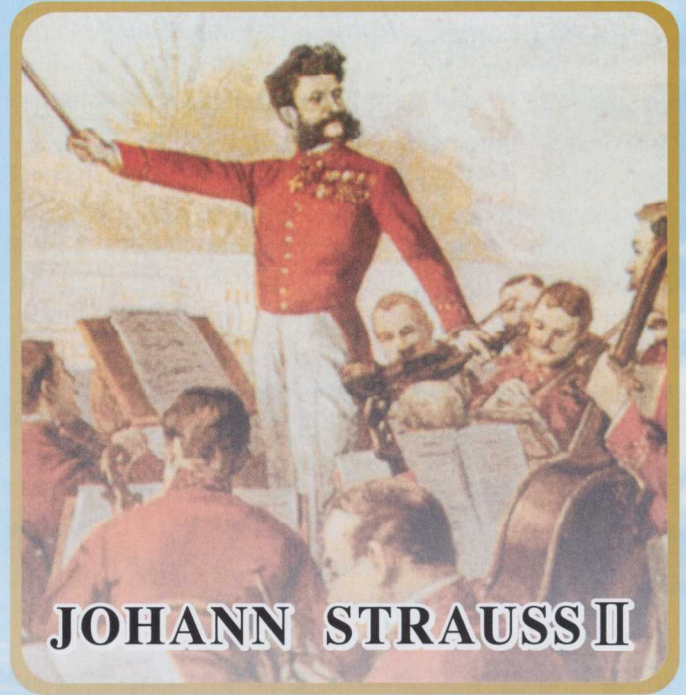
JOHANN STRAUSS II